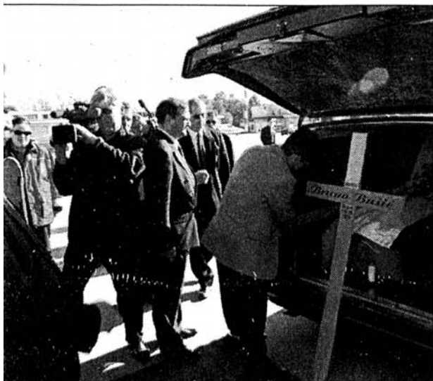
Doček u Zagrebu