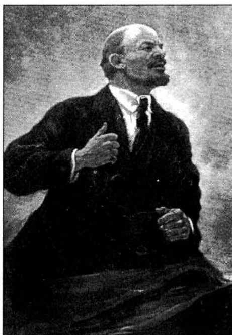
Lenjinova se personalna politika svodila na sljedeće: "U službu treba uzimati odlučne ljude, koji znaju da nema ništa djelotvornije od metka da bi se nekoga ušutkalo!"

Usred Prvoga svjetskog rata vođa ruskih boljševika V. I. Lenjin, koji je bio u emigraciji, gdje je uživao i financijsku potporu Središnjih sila, pozvao je svoje pristaše da bez obzira na cijenu koju će platiti ne samo carizam, nego i Rusija, postojeći rat prometnu u građanski. U rujnu 1916. objavio je kako prihvaćanje učenja o klasnoj borbi podrazumijeva prihvaćanje postulata da je građanski rat neizostavna pretpostavka vođenja i zaoštavanja klasne borbe. Tako zametnuti građanski rat u povijest je ušao pod nazivom Oktobarska revolucija, a svoj dug Središnjim silama Vladimir Iljič je velikodušno platio mirom u Brest-Litovsku, koji se u marksističkoj historiografskoj pamfletistici s ponosom nazivao "mirom bez ratnih odšteta i reparacija".