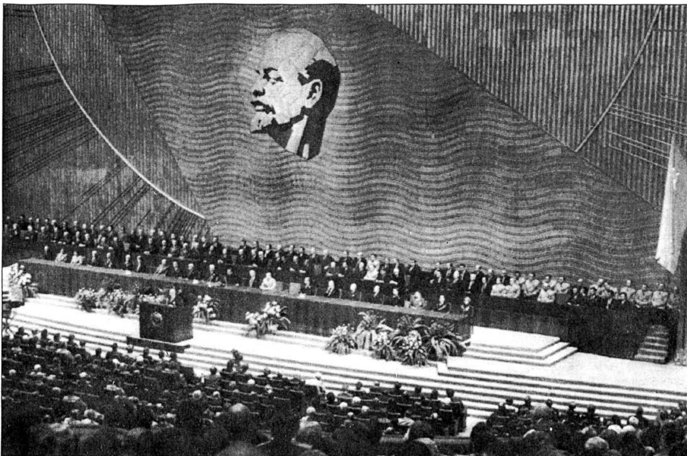
Zametnuti građanski rat u povijest je ušao pod nazivom Oktobarska revolucija - proslava 66. obljetnice u Moskvi

NA KRAJU STOLJEĆA NASILJA I TERORA: CRNA KNJIGA KOMUNIZMA