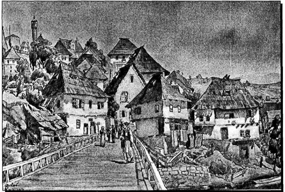
T. Krizman: Jajce, drveni most (u prvoj polovici 20. stoljeća)

pripadnika njegove partizanske postrojbe u Lici činili Srbi. 7 I u Zapadnoj Slavoniji Hrvati se 1941. slabo ili nikako ne odazivaju pozivima u šumu, pa je i u tom dijelu Hrvatske pobuna zapravo ograničena na srpsko pučanstvo. Zajednički nastupaju organizirani komunisti i odmetnuti srpski seljaci, od kojih neki otvoreno nose znakovlje, kojim pokazuju svoju privrženost kralju Petru. 8 Ista se situacija ponavlja i u sjeveroistočnim dijelovima Hrvatske, 9 kao i u Dalmaciji.