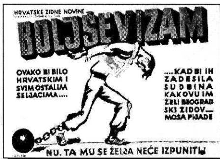
Antikomunistički ton Hrvatskih zidnih novina (1944.)

Kopinič, sa svrhom eliminiranja jugoslavenski orijentiranoga partijskog vodstva i ustrojenja samostalne KPH, sve u sklopu priprema sovjetskog priznavanja NDH. Budući da je već došlo do njemačko-sovjetskog rata, ta ja postavka neozbiljna. S druge strane, u posljednje se vrijeme ne isključuje mogućnost da je sam Tito, pod utjecajem srpskih krugova u KPJ, inscenirao akciju u kojoj je imao stradati vrh one struje, koju su neki krugovi u ideološkom pogledu smatrali revizionističkom, a u nacionalnom pogledu nedovoljno jugoslavenskom. Međutim, da ta tvrdnja nije uvjerljiva, govori činjenica da je glavnina interniraca bila izrazito jugoslavenski orijentirana, te bezuvjetno odana KPJ i Kominterni. Čini se kako je najuvjerljivija pretpostavka da je Kopinič, nezadovoljan nedostatkom borbene aktivnosti u Hrvatskoj, ovim