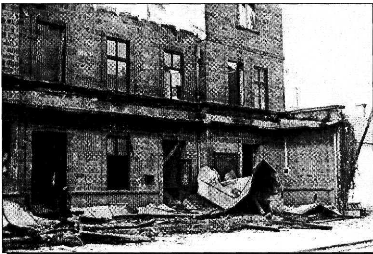
Razorena zgrada željezničkog kolodvora u Jajcu 1942.

Pobuna je, razumljivo, otežavala opskrbu pučanstva, bilo zbog pljačke odnosno uništenja usjeva, bilo zbog oštećenja ionako slabih prometnica. Time se povećavalo nezadovoljstvo stanovništva i stvarala podloga za širenje pobunjeničke baze.