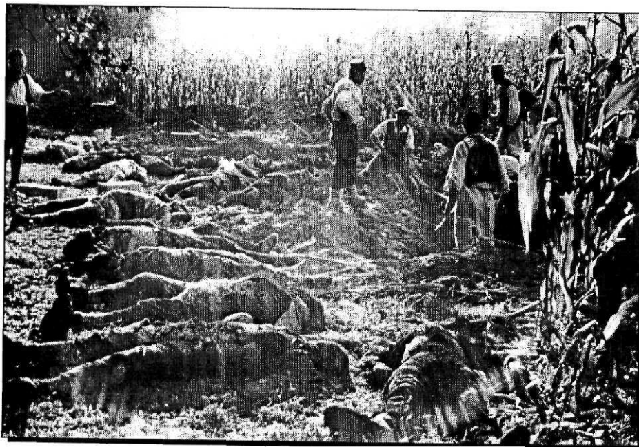
Ubijeni civili i vojnici u Jajcu - žrtve partizana - 1942.