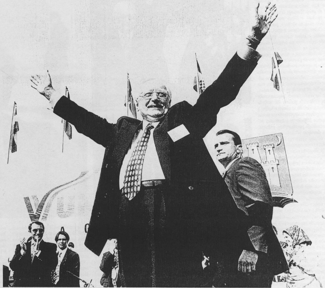
Dana 8. lipnja 1997. predsjednik Tuđman vlakom mira došao je u Vukovar tijekom procesa mirne reintegracije

Tuđman je njezin sudionik od najranije mladosti. Odgojen u duhu učenja Stjepana Radića – kojemu je Ivo Pilar razložno predbacivao da se uporno i uvijek na štetu Hrvatske koleba između nacionalnih ciljeva i internacionalnih himera – Tuđman je ostao trajno privržen svojoj dječjačkoj slici o seljačkom vođi. Radićev socijalni program,