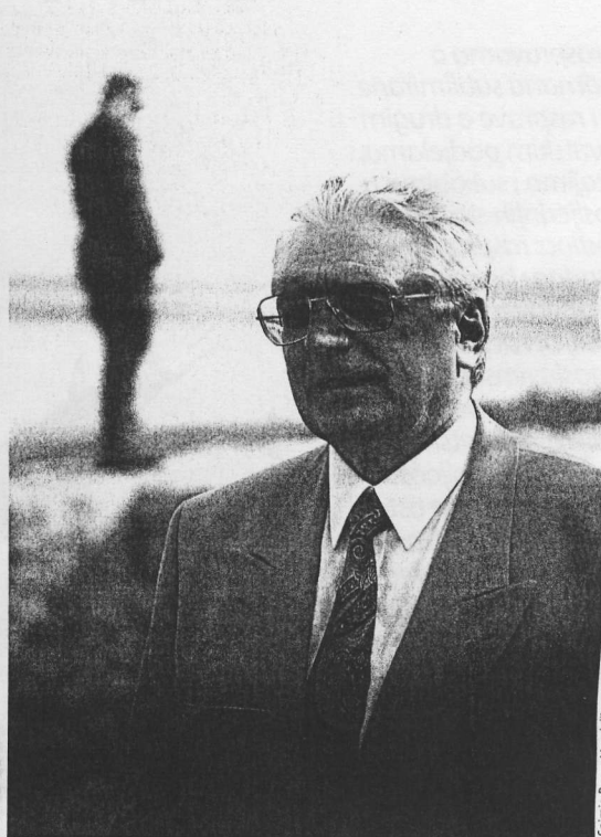
Predsjednik Tuđman u Kninu 6. kolovoza 1995.

Je li dominaciju u Hrvatskoj demokratskoj zajednici, a potom i prve demokratske izbore 1990. godine, osvojio u nejakvom meštofelskom zagrljaju s pragmatičnijim dijelom hrvatsko-jugoslavenskih komunističkih struktura, koji je samo u nekom aranžmanu s oporbenim snagama mogao sačuvati ponajprije glavu, a potom i presudan utjecaj u društvu, ostat će i dalje zagonetka. No, sa sigurnošću se