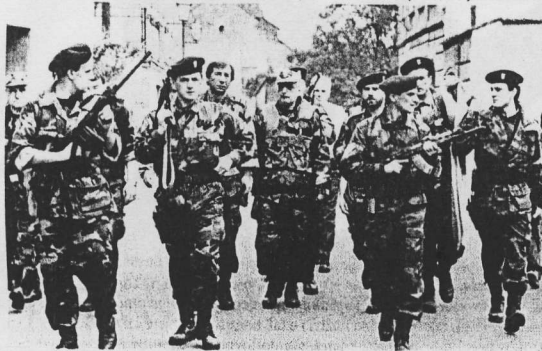
Tuđman s hrvatskim vojnicima na bojištu

koji je točno znao što hoće, a činilo se da znađe i kako će to postići. To je, ujedno, bio početak posljednje faze njegova političkog razvitka, faze koja je okončana raskidom sa svim socijalističkim tlapnjama i jugoslavenskim iluzijama.