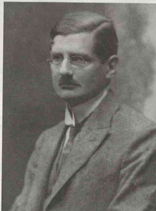
DR. IVO PILAR (1874. - 1933.)

Iako je sljepilu habsburške odnosno austrijske politike pripisivao veliki dio krivice za težak položaj hrvatskog naroda, Pilar je bio uvjeren da će razbuđeni mađarski nacionalizam, koji je tražio načina kako da se oslobodi utjecaja Austrije, i koji je istodobno bio impregniran sekularističkim i dijelom otvoreno protukatoličkim utjecajima, uvijek lako naći zajednički jezik s protuaustrijski i protukatolički raspoloženim Srbima. Na temelju studija povijesti