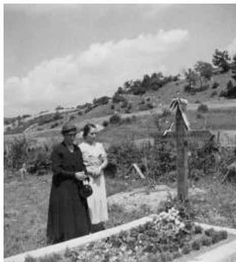
Majka i sestra na Hranilovićevu grobu u Sošicama 1935.

«Stoji činjenica, da su spomenuta trojica [Hranilović, Soldin i Križnjak] vršili krivična djela u cilju navedenom u tački 1. čl. 1. Zak.[ona] o z.[aštiti] j.[avne] b.[ezbednosti] i p.[oretka] u d.[ržavi], da su ta djela vršili i neki drugi optuženici u istom cilju, da su ta djela vršena po uputi Gustava Perčeca, da su pojedini optuženici imali podijeljene uloge kod vršenja tih krivičnih djela, u kratko vulgarno rečeno, da je posao bio organizovan, ali na glavnom pretresu nisu iznesene nikakove činjenice ni dokazi za to, da su spomenuta trojica organizovali neko udruženje, i da su mu postali članom, a neki drugi od optuženih, da su pomagali to udruženje». 79 Drugim riječima, ocijenjeno je kako to organizirano djelovanje nije bilo zločinačko udruženje u kaznenopravnom smislu. U tom smislu je ključna teza optužnice doživjela neuspjeh. 80