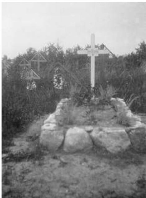
Soldinov grob u Stupniku

stvarnosti se nalaz sudskog vijeća podudarao s onim što se doista zbilo: u neposrednoj izvedbi atentata sudjelovali su Babić i Soldin, koji su Schlegela čekali pred kućom u kojoj je stanovao, dok ga je Hranilović dotle pratio od zgrade u kojoj je urednik Novosti radio. Smrtonosne je hitce ispalio Babić. 91